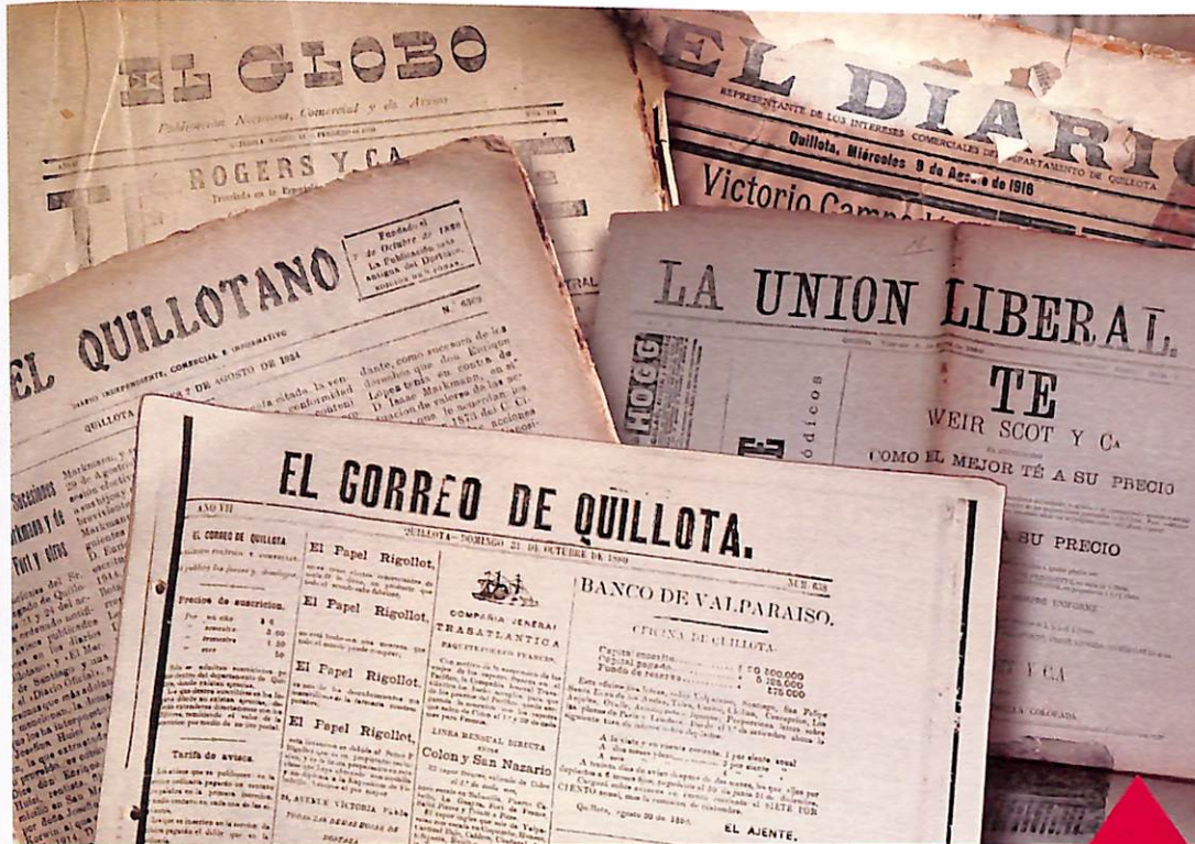
Imagen de diferentes diarios de la época, utilizados en éste proyecto.

El 05 de abril de 1874, fue fundado el periódico "El Correo de Quillota", de línea política, literaria y comercial, su oficina funcionaba en calle Maipú y salía los días jueves y domingos.